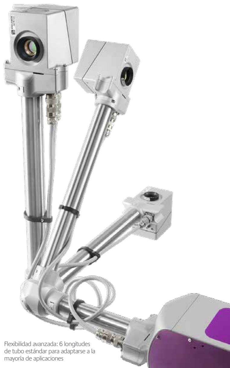
Flexibilidad avanzada: 6 longitudes de tubo estándar para adaptarse a la mayoría de aplicaciones

La unidad BOU se diseñó cumpliendo los exigentes estándares de seguridad de MI, e integrarla en el sistema de marcado no afecta a la protección IP55 de fábrica.